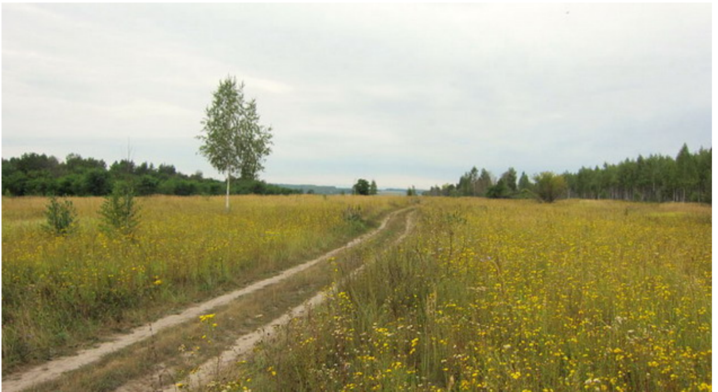
Окрестности деревни Клёсово