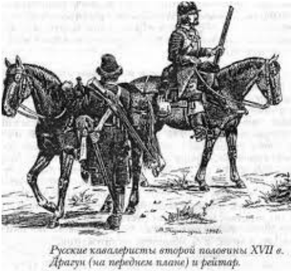
Русские кавалеристы второй половины XVII в. Драгун (на переднем плане) и рейтар.