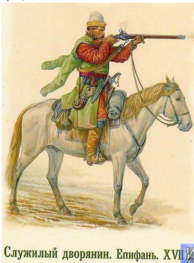
Служивый дворянин. Епифань. XVI-XVII вв.

https://www.pinterest.com/pin/758504762230092721/